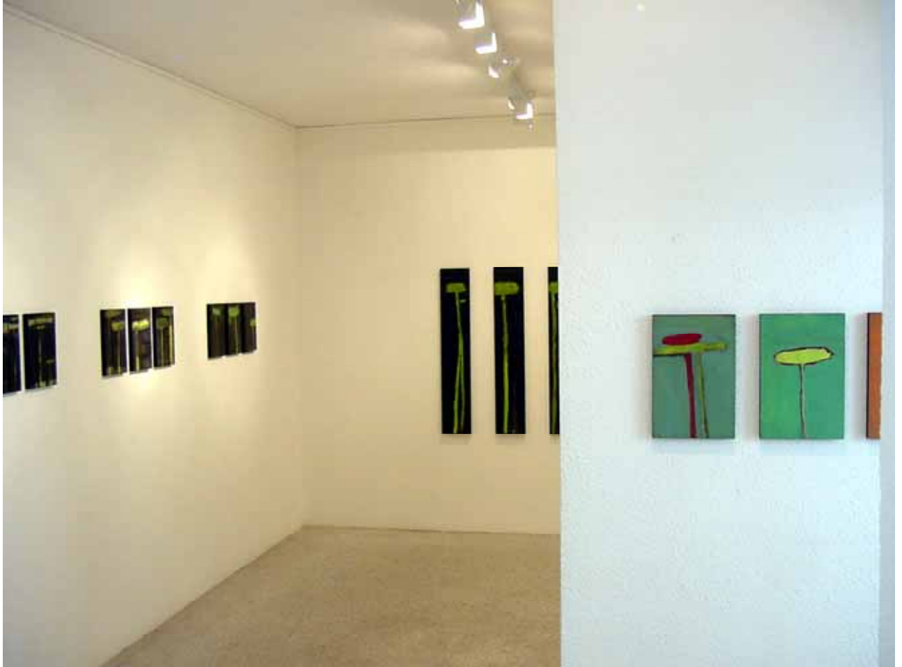
'growing' Ausstellungsansicht Galerie Ursula Huber Olten 2002