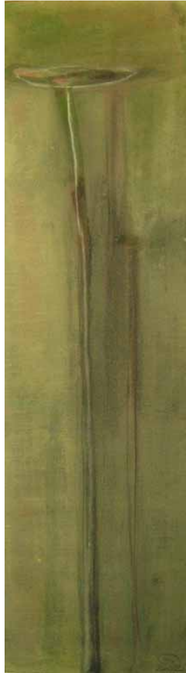
'growing' Mischtechnik auf Holz je 70 x 19.5 cm 2002 Privatesammlung Schweiz