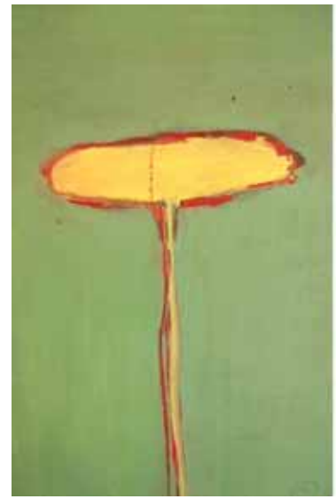
'growing' Oel auf Papier auf Holz je 29.5 x 19.5 cm 2002