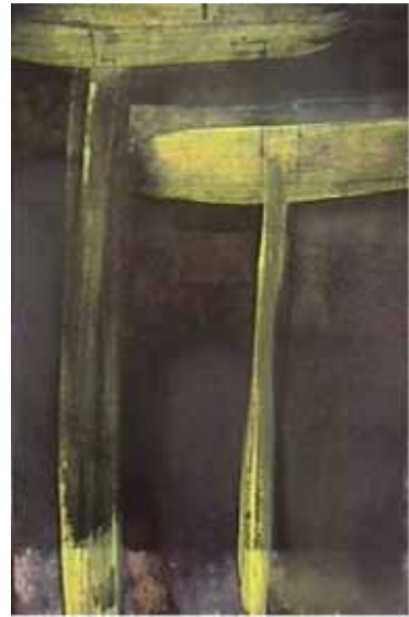
'growing' Mischtechnik auf Papier auf Holz je 29.5 x 19.5 cm 2002