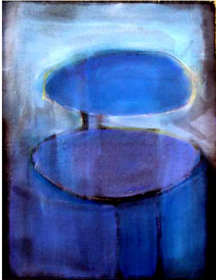
' blue ' Acryl auf Leinwand 50 x 40 cm 2004