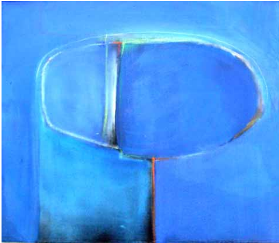
' blue ' Acryl auf Leinwand 35 x 40 cm 2004