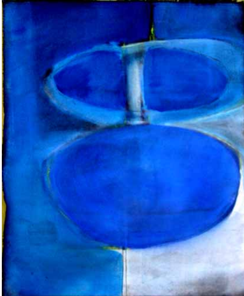
' blue ' Acryl auf Leinwand 50 x 40 cm 2004