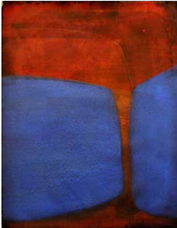
' blue ' Acryl auf Leinwand 40 x 25 cm 2004