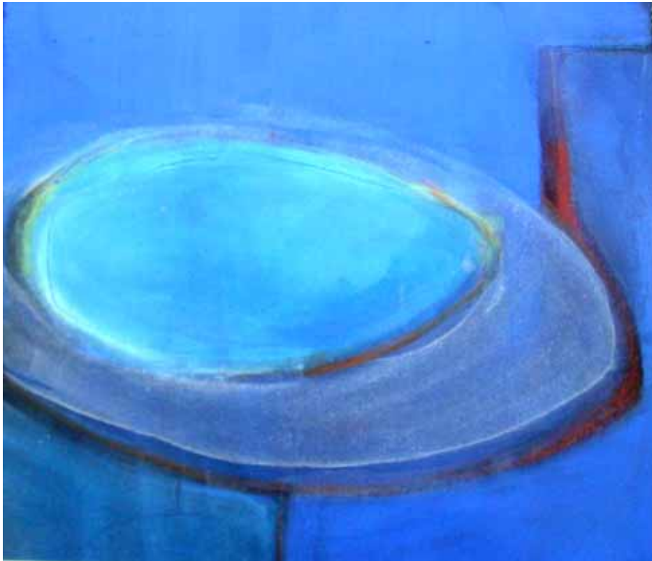
' blue ' Acryl auf Leinwand 35 x 40 cm 2004