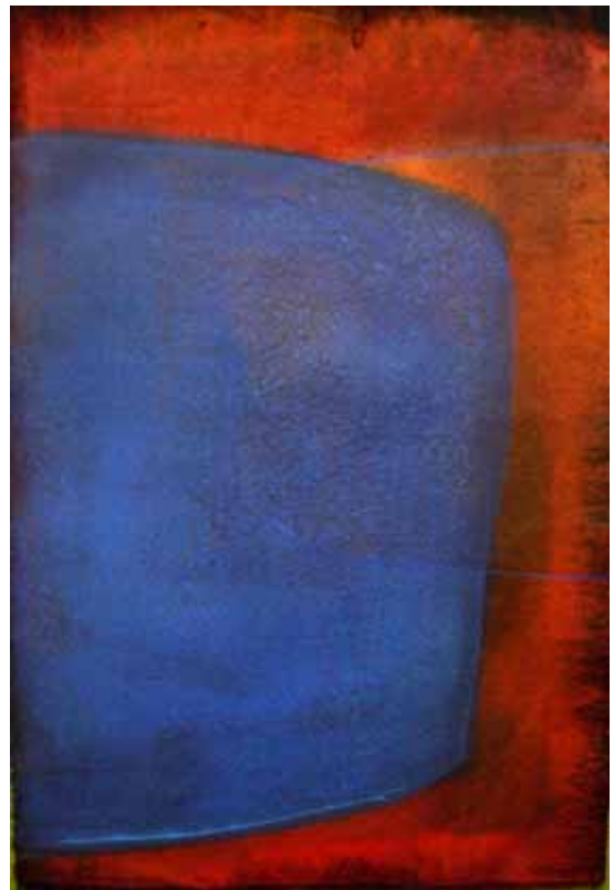
' blue ' Acryl auf Leinwand je 40 x 25 cm 2004