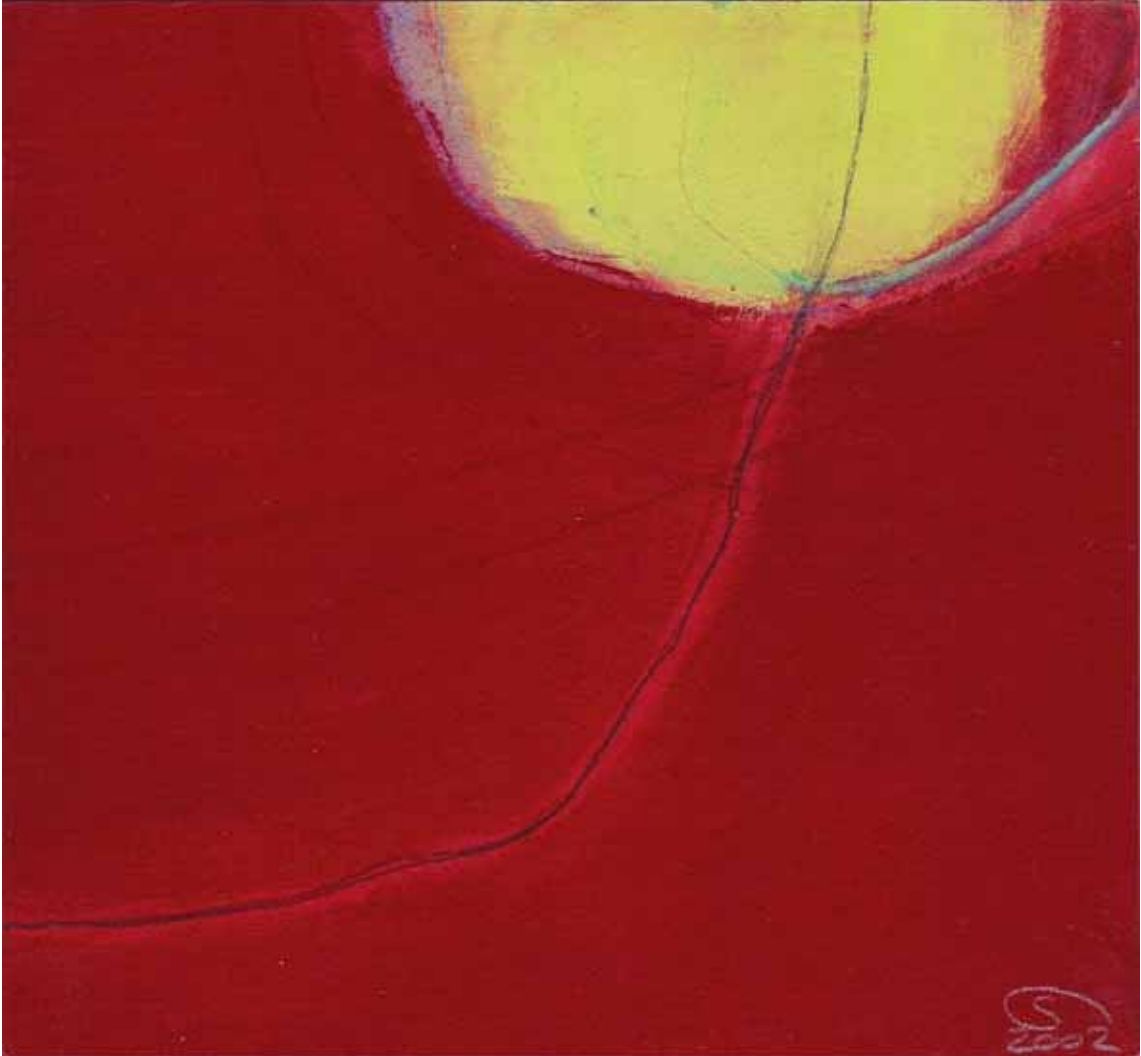
' Zauberstaub Nr. 5 ' Mischtechnik auf Papier auf Holz 17.8 x 16.5 cm 2002