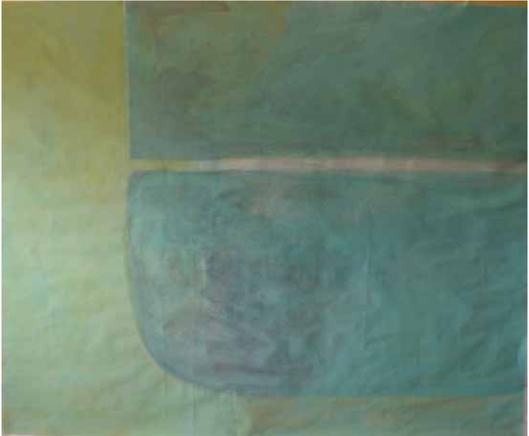
' Fenster in Genua ' Acryl auf Papier 150 x 180 cm Genua 2005